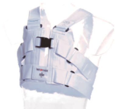
Chaleco de apoyo esternal POSTHORAX®

Determinar el talle: con una cinta métrica, comience a medir desde la espalda, por debajo de las axilas, hasta la parte superior del tórax. Si la medida se toma por el abdomen, o en las mujeres, por el busto, se obtendrá un talle incorrecto.