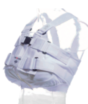
Chaleco de apoyo esternal POSTHORAX® con sostén